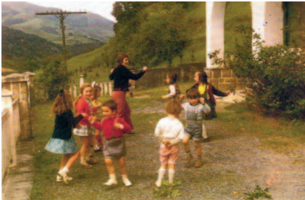
San Gregorioko Ikastolako haurrak dantzan, mediku etxearen aurrean.

San Gregorion bi eskola nazional zeuden, bata mutilentzat eta bestea neskentzat, bakoitza bere maisu-maistrarekin, hauek ikastola sortu zenean haur gutxirekin gelditu ziren. Berehala hasi ziren arazoak: kalitatea, metodoa, erlijioa, titulu eza, politika... argudio hartuta apaizak ikastolatik pixkana pixkana urruntzen joan ziren eta maisu-maistrek elkarturik gogor ekin zioten ikastolaren aurka. Auzoan zehar salaketa faltsu eta iraingarriak zabaldu zituzten, politika eta erlijio gaietan gurasoak eta aldi berean herritarrak beldurtuz. Batzar bat egitera ere iritsi ziren, apaiz eta maixu-maistrek auzo batzarrera deitu zituzten guraso eta auzokide guztiak. Jende asko elkartu omen zen eta tentsio handiko unea bizi izan omen ziren, bertan salaketa gogor eta poizintsuak entzunez ikastolaren aurka.