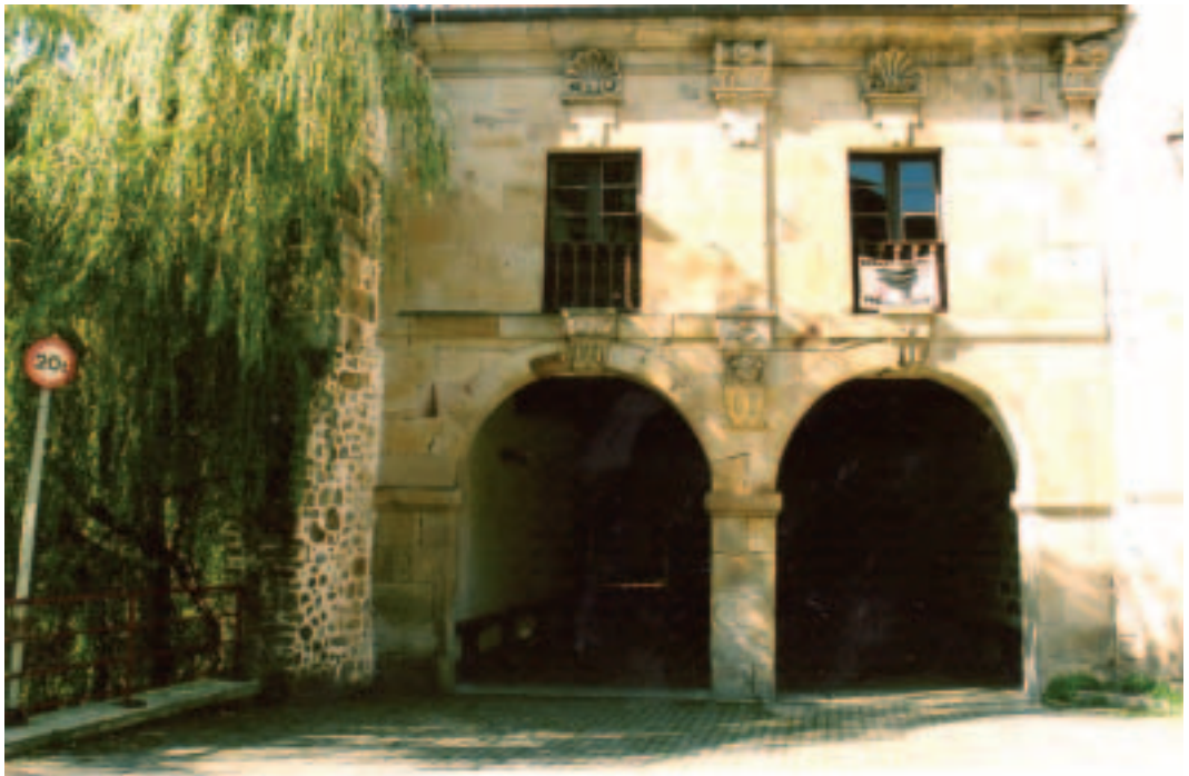
San Martingo eskola nazionalak, Eleizganbara etxean.

Gerora, San Martin auzoko eskola, Eliz ganbara deitzen zen etxean kokatu zen. Etxe hau, San Martin elizako kalostra gainean edo gaur egun OARGI-Troskaeta elkarte dagoen lekuan zegoen eta gela hauetan jarraitu zuten auzo honetako neska eta mutilen “eskola nazionalak”, 1971 urtean desagertu arte.