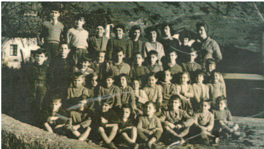
1961ean, Arrondo auzoko eskolako ikasleak.