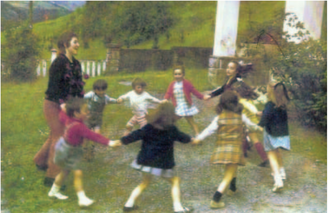
San Gregorioko ikastolako haurrak jolasean.

Hurrengo ikasturtean, haur gehiago etorri zen Ikastolara eta hor ere ikusi zen herritarren nahia eta aukera.