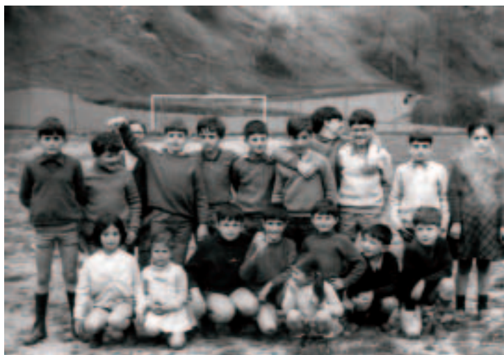
1961ean, San Martingo eskola nazionaletakoa ikasleak.