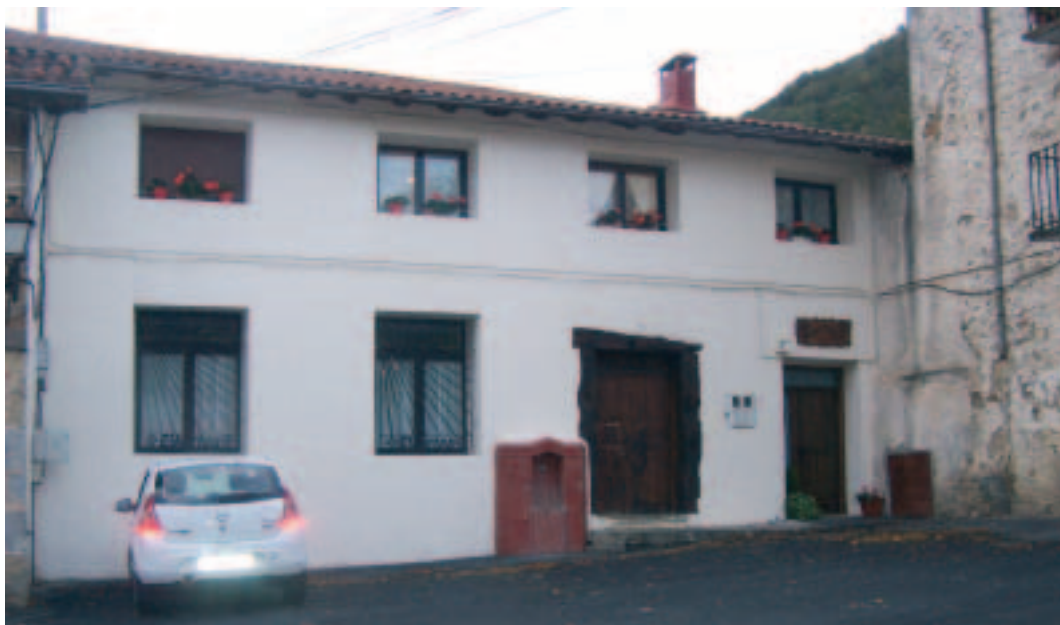
Aian 1915ean irekitako eskola berria.