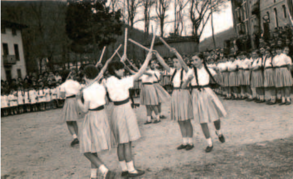
1959an, "Frente de Juventudeseko Sección Femeninak" eraturako ikastaro trinko baten bukaeran, "Servicio Social" lortu zutenen ageri banaketa ospatzeko, jaialdi bat prestatu zuten, bertara Gobernadore Zibila ere etorri zelarik.

Emakume hauek, Bidarte Haundia etxean egon ziren hilabete inguru eta euren ardurapean, sukaldaritza, eskulan (joste, kanastillak, bordatze, puntu laboreak...) lanetan ikasten aritu ziren hainbat emakume gazte herritar. Ikastaro bukaeran, jaialdi handi bat antolatu zuten, dantzariak, abestiak,... Gobernadore jauna ere bertan izan zen. Ikastaroan ibilitakoei, edozertarako balio zuen ziurtagiria ematen zieten.