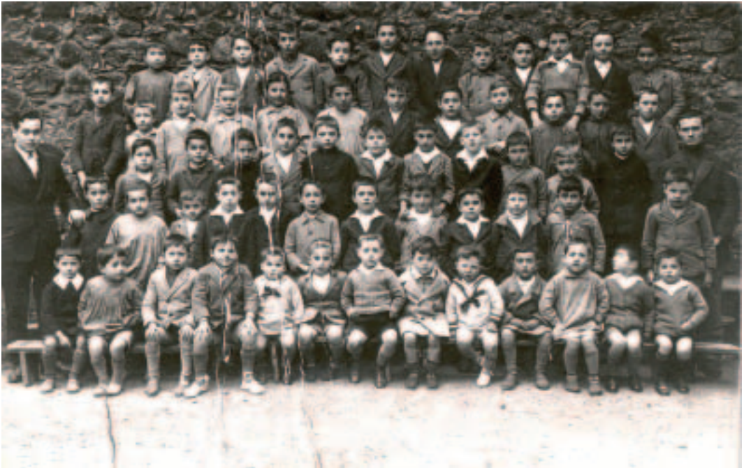
1932an, San Martingo eskola nazionalako mutilak: