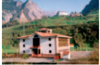
1984an eraikitako Joxemiel Barandiaran herri eskola.

Betidanik guraso eta irakasleen nahia gure eskola, euskara eta euskal kulturarekin lotua egotea izan da. Ataun, herri euskalduna izanik, ez zeukan inongo zentzurik hori horrela ez izateko, eskola, bere inguruarekin lotua egon behar baita. Eskolako martxan parte hartzen zutenek hori garbi zutelako, historian zehar ahalegin handia egin zuten hori horrela izan zedin. Euskal Jaurlaritzak hezkuntzako kompetentziak bereganatu zituenean ere, eskolako organoek irakasle guztiak euskaldunak izan zitezten behin eta berriz aldarrikatu zuten.