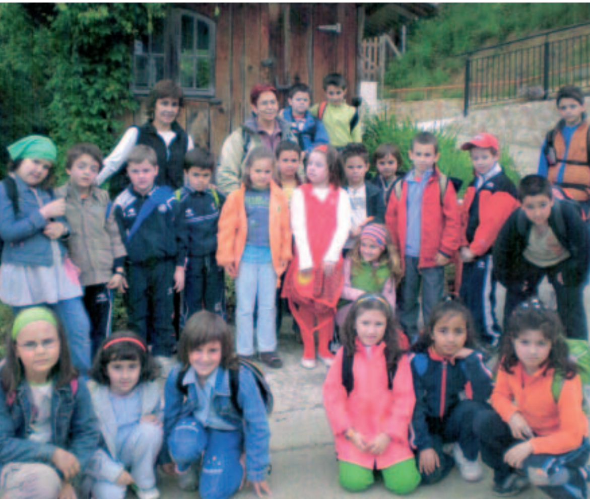
2006/2007 ikasturtean Urretxuko erletegian.