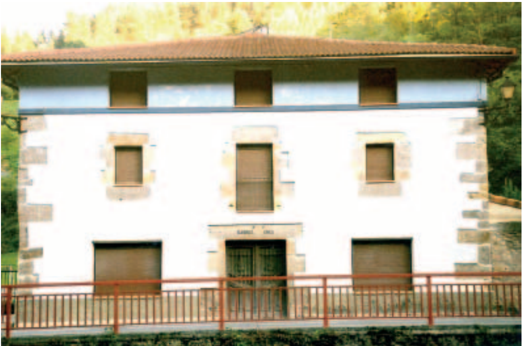
Gabil-enea etxea, 1956an Merzedariaren eskolotako eraberritua.