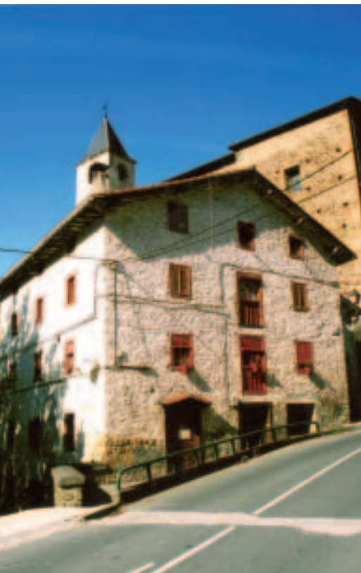
San Gregorioko Elizondo etxea. 1863an, auzoko eskolatako bi gela prestatu ziren bertan.