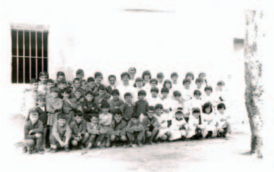
Aiako haurrak 1965ean.

1971ko urriaren 22ko aginduz itxi zuten Aiako eskola.