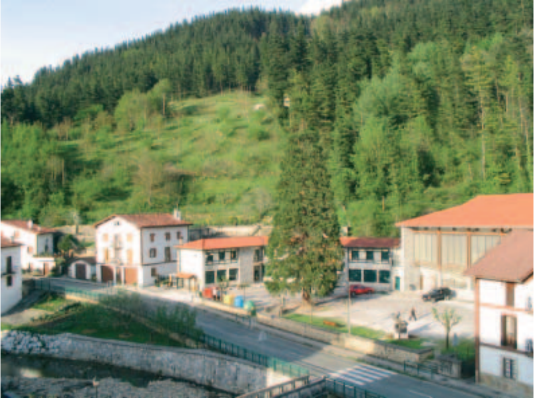
1963an, San Gregorioko eskola nazional berriak.