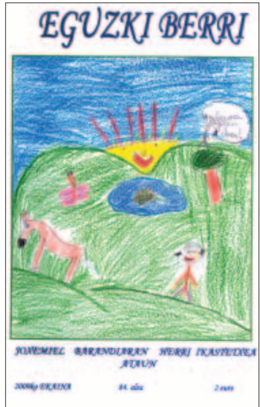
Eguzki Berri, eskolako aldizkariko bi aleren azalak.