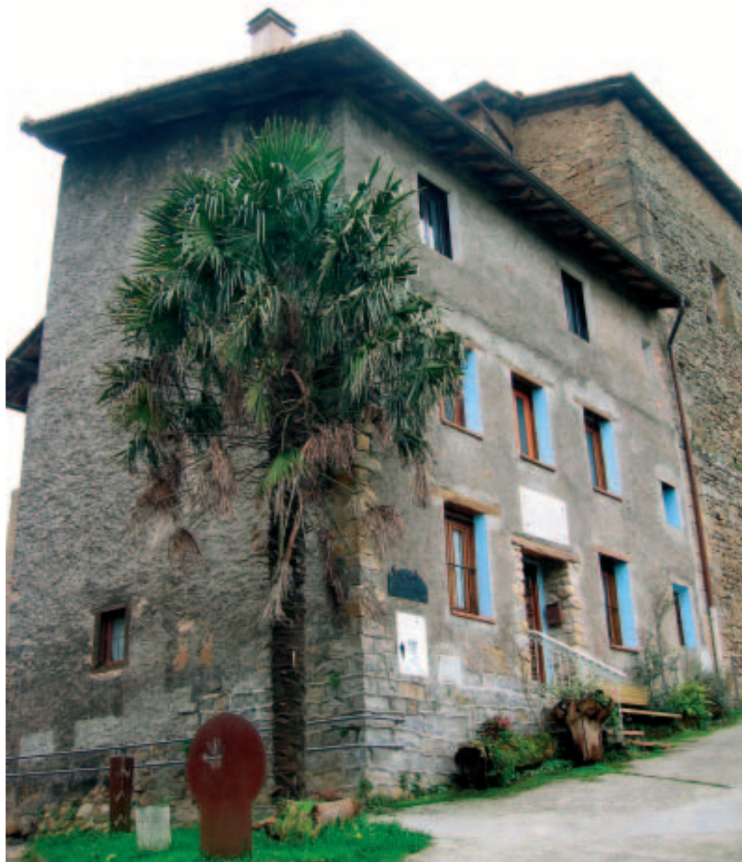
San Gregorio auzoko Arrate buru etxea (gaur egun San Gregorio txiki deiturarekin ezagutzen dena). 1796ean, bertan hartu zituen haurrak lehen maisuak 1862ra arte.