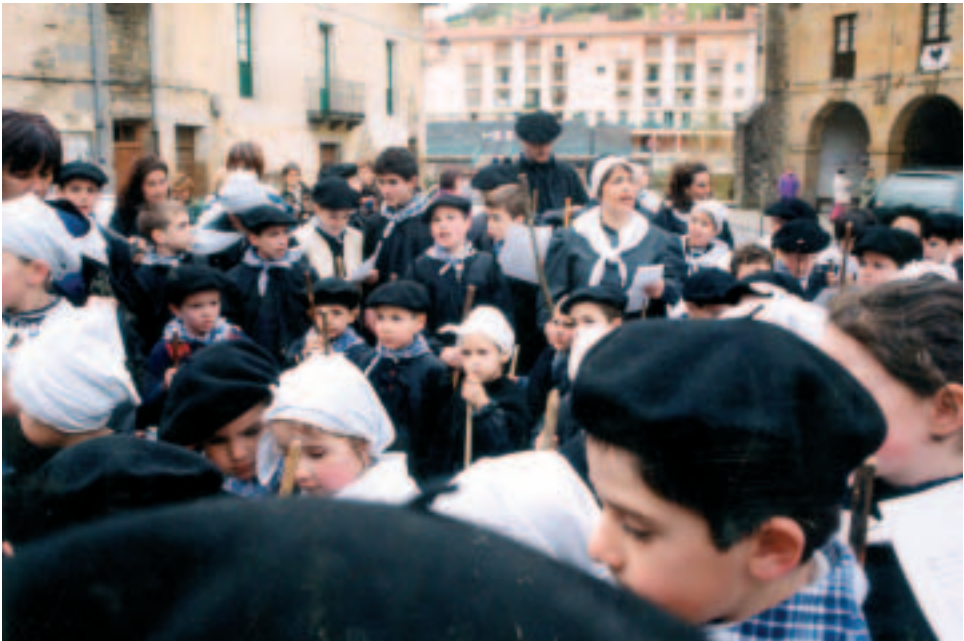
2000. urtean, Santa Ageda bezperan, herri eskolako haurrak.

tutako irakasleak aritu dira lan horretan. Bestalde 1996-1997 ikasturteetik aurrera, Irakaskuntza- ren Erreforma legearen ondorioz, Lehen Hezkuntzako 6. mailara arteko ikasleak izan genitue- nean, 3. mailatik gorako ikasleak hasi ziren ikastorduetan ingeleseko klaseak jasotzen. Garai hartan ikasliburuak eta lan koadernoak erabiltzen ziren. 1999-2000 ikasturtean, Eusko Jaurlari- tzako Hezkuntza Sailaren INEBI, esperientzia eleanitzaren barruan, "Ingelesaren sarrera goiz- tiarra" programa martxan jarri zen. Haur Hezkuntzako 4 eta 5 urteko mailetan hasi zen pro- grama hau lantzen. 2001-2002 ikasturtean berriz, Lehen Hezkuntzako Oinarrizko Diseinu Curricularra oinarritzat hartuta 1. mailan ezarri zen programa hori eta ikasle hauek 2006-2007 ikasturtean 6. maila egin arte. Urte horretan, Haur Hezkuntzako 2. zikloan eta Lehen Hezkuntza osoan INEBI programa ezarrita geratu zen. Gaur egun horrela jarraitzen dugu. Bestalde ikas- turte honetarako Hezkuntza Sailak 6. mailako ikasleentzako astebeteko ingeleseko barnetegiak antolatzeko asmoaren berri eman du, oraindik zehaztasun askorik ez izan arren. Horrelako ikas- taroak positiboak izango dira arlo honetan trebatzeko.