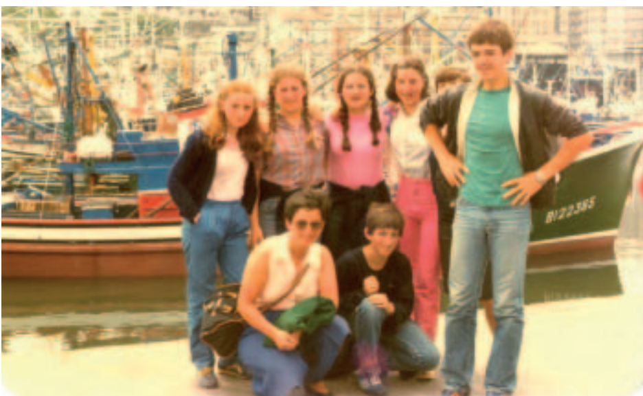
1981 ean, Patronatoko haurrak Bermeen.