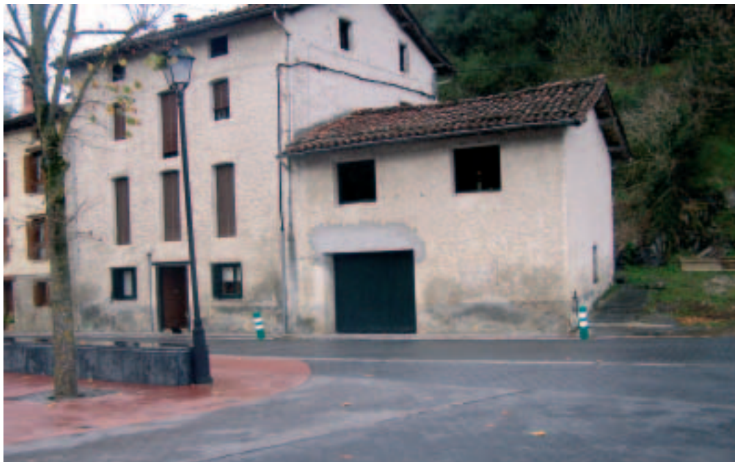
Ergoienako Arbelditxo edo "Amirazio" etxea bere ikuluarekin. 1949an ikulu honen gainean ireki zuten auzoko eskola.