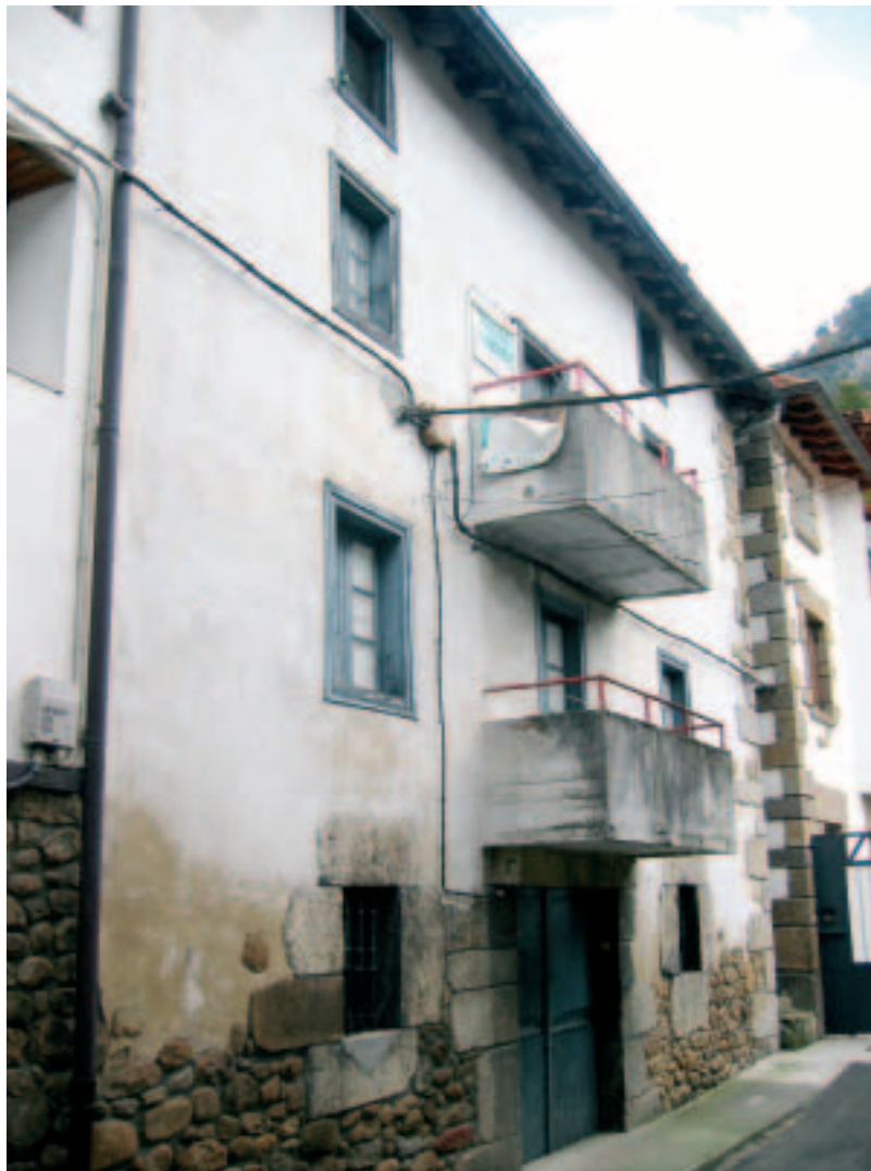
Astigarragako Etxagora etxea. Hemen ireki zen herriko lehen eskola 1609an.

Esan bezala, Ataungo eskolako maisuari buruzko lehenengo aipamena 1609koa da, beraz ez zen atzera gelditu eta inguruko herrien ekimenen parean zebilen gure herria. Garai hartan herriko eskola bakarra, Astigarraga auzoko Etxagora etxean zegoen kokatuta eta gela batean adin desberdinetako haurrak elkarrekin egoten ziren. 3