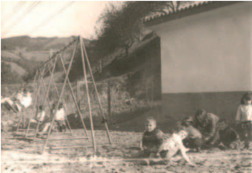
San Martingo Ikastolako haurrak jolasean.