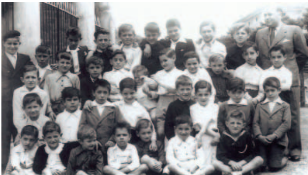
1942an, San Martingo eskola nazional-etako mutilak.