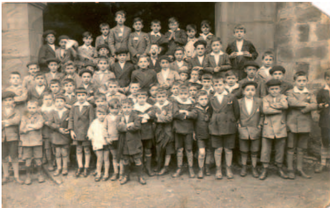
1933an, San Martingo eskola nazionalako mutilak.

Tamalez, II. Errepublikara garaiko dokumentazioa falta zaigu herriko artxioban, inguruko beste hainbat herritan gertatu ohi zen bezala, Gerra Zibilak bere aurrekoa erabat suntsitu nahi izan zuen, baita gurean ere.