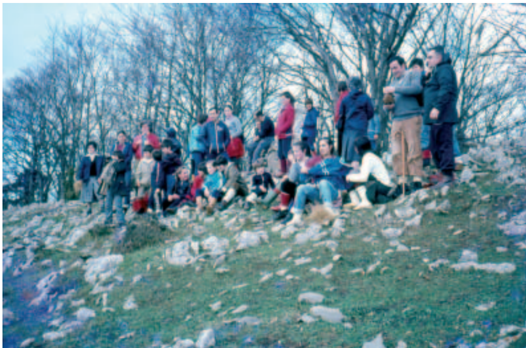
"Alleko" mendira ibilaldia, guraso eta haurrak.

Hezkuntzako ikasleek gaiak lantzeko dituzten CDak erabiltzeaz gain interneten bidez beste lan asko egiten dute: informazioa lortu, ariketak on line egin... Geroko hezkuntza geroz eta gehiago teknologia berriekin lotua egongo denez gero, umeak txikitatik horretan prestatzen joateak garrantzi handia dauka. Hezkuntzak jarrita dituen aplikazioak erabiltzen dira kudeaketa ekonomiko programan, eskolako datuetan: irakasle eta ikasleenak, orduategiak, egutegiak, hutsegite faltak, estatistika.