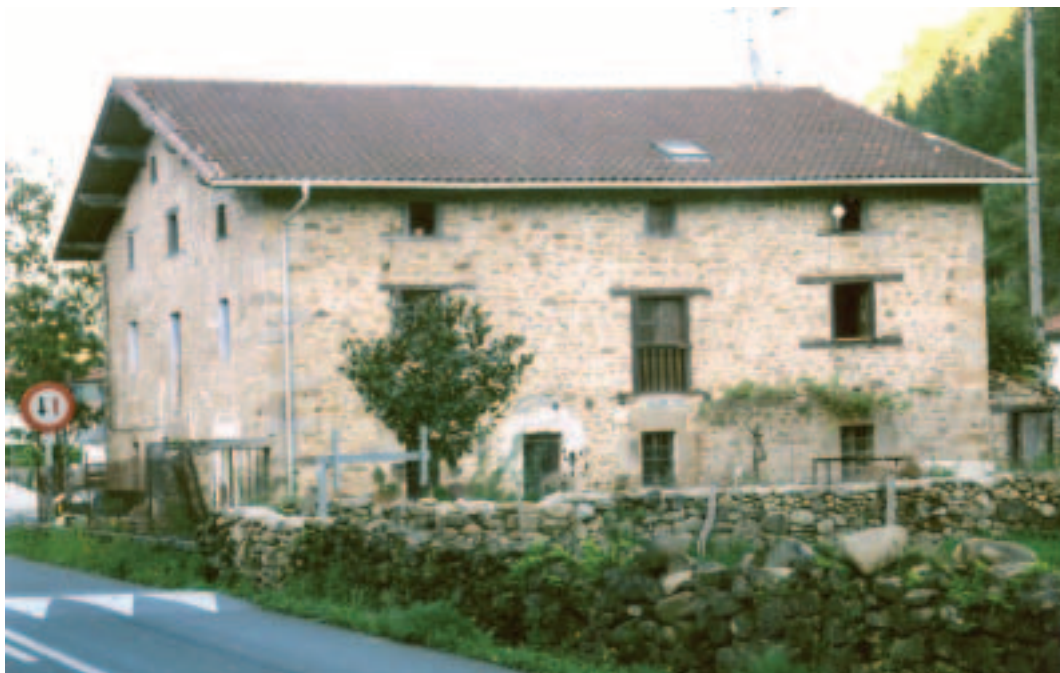
Arrondoko Kamio etxea. Beheko solairuan ireki zuten eskola nazionala 1936an.